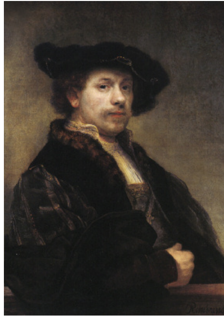
1640 – 34 jaar