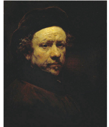
1657 – 51 jaar

schilderij ons iets bijbrengt, wat in de onmiddellijkheid van het leven, waar we van aangezicht tot aangezicht staan, aan onze aandacht ontsnapt.