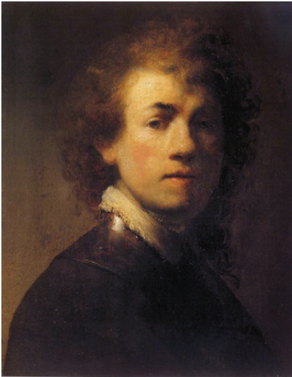
1629 – 23 jaar