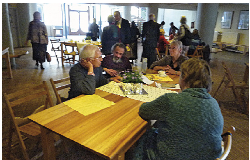
Na de lezing gonsde de foyer van de gesprekken

Een vriendenkring die werk wil maken van het thema dialoog en gesprek, is het aan zichzelf verplicht hier iets aan