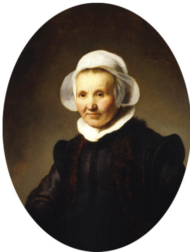
Onderdeel van de tentoonstelling Made in Holland is deze Rembrandt: Portret van Aeltje Uylenburgh, 1632